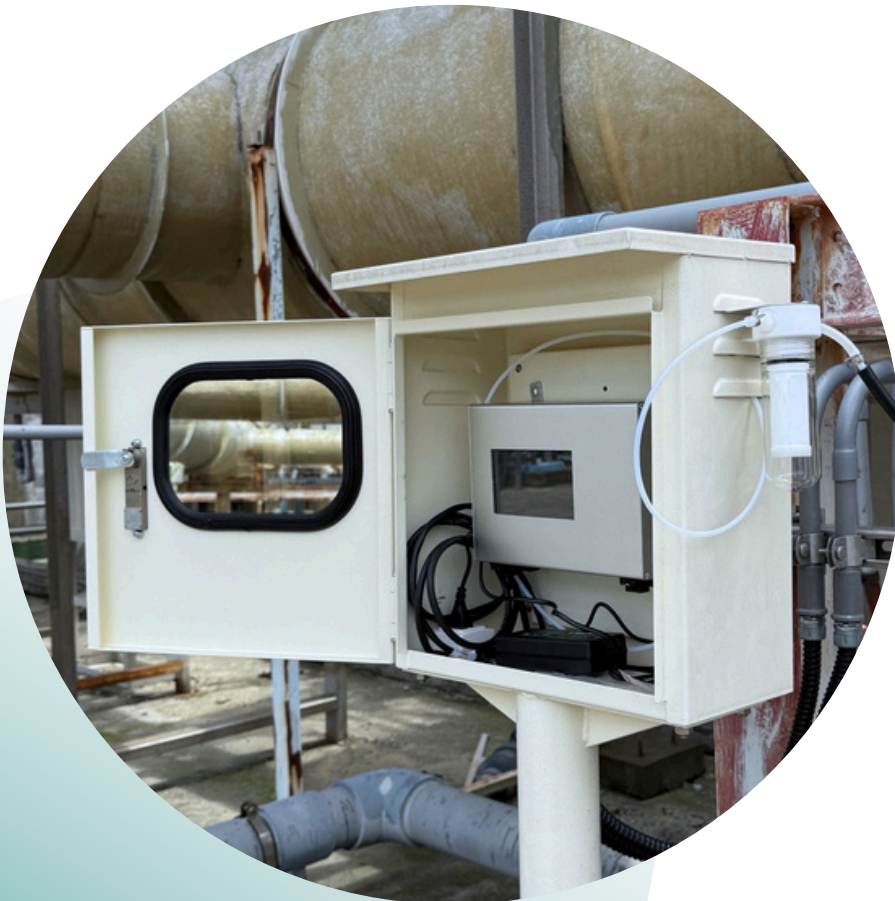
安裝於竹南某知名面板大廠之實景圖

TEL:03-582-2099 FAX:03-583-0389 LINE@ ID : @757wfque www.belltone.com.tw