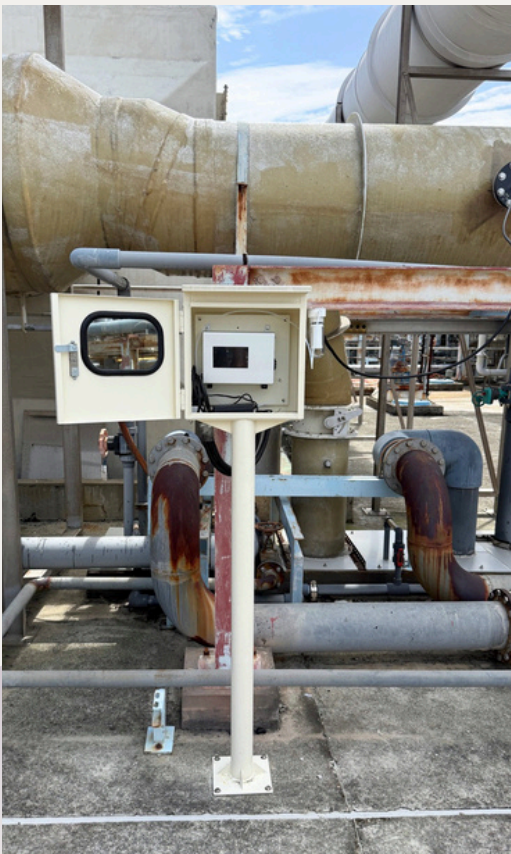
安裝於竹南某知名面板大廠之實景圖