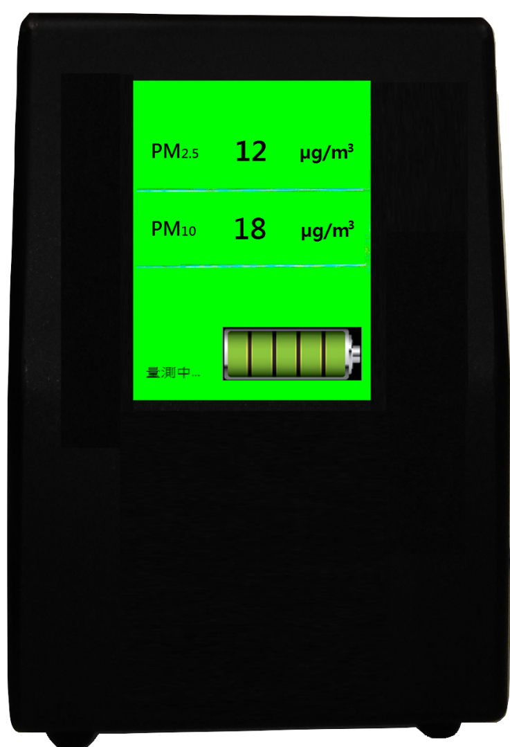
圖片僅供參考，以實際出貨為主