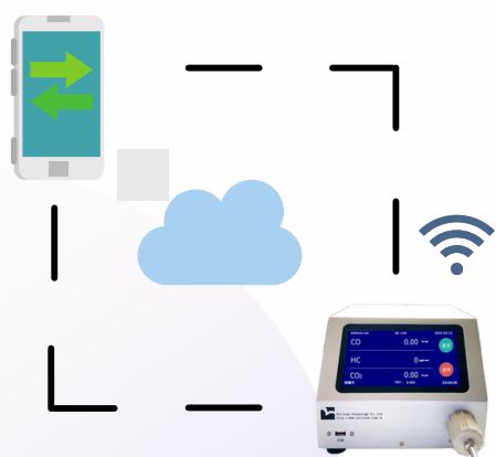
流程示意圖 僅供參考